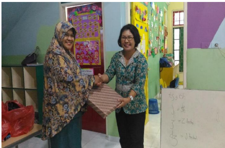
Gambar Pemberian Ucapan Terima Kasih kepada Kepala Sekolah TK Education 21 Pekanbaru