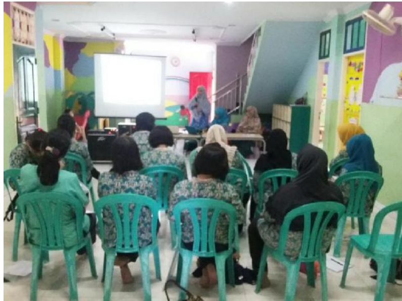
Gambar Pengabdian 1