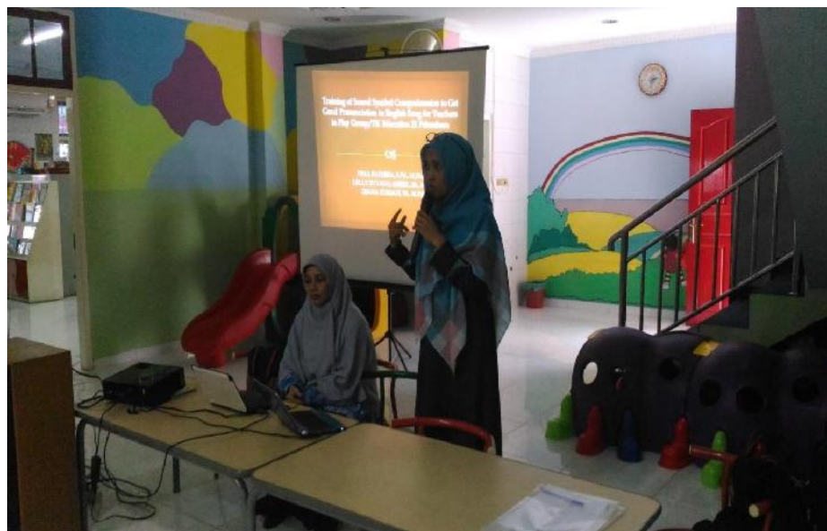
Gambar Pengabdian 2

Berdasarkan hasil kegiatan pengabdian yang berbentuk pelatihan membaca sound symbol ini dapat dikatakan bahwa kegiatan pengabdian ini berhasil dilakukan. Hal ini sesuai dengan target yang telah ditentukan sebelumnya. Catatan harian dan foto kegiatan merupakan bukti dari berhasilnya kegiatan pengabdian ini.