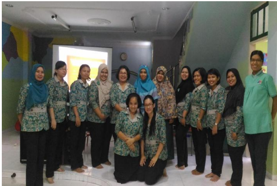
Gambar Pengabdian 4