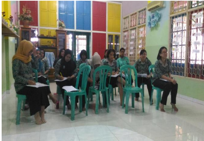
Gambar Pengabdian 3